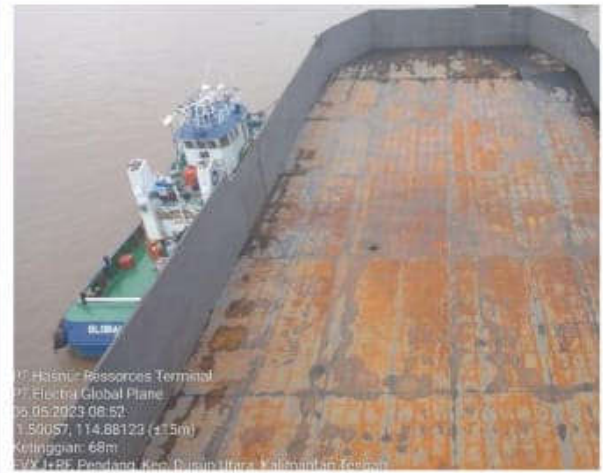
PT. Hasnur Resources Terminal PT. Electra Global Plane 06.05.2023 08:52 1.50057, 114.88123 (±15m) Ketinggian: 69m X:VX+RF, Pendang, Kec. Dusun Utara, Kalimantan Tengah