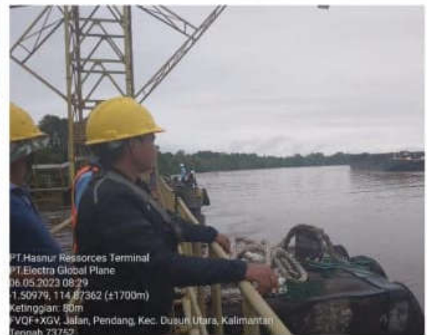
PT. Hasnur Resources Terminal PT. Electra Global Plane 06.05.2023 08:29 1.50979, 114.87362 (±1700m) Ketinggian: 80m X:VQF+XGV, Jalan, Pendang, Kec. Dusun Utara, Kalimantan Tengah 73752