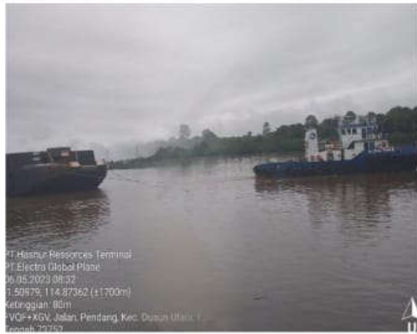
PT. Hasnur Resources Terminal PT. Electra Global Plane 06.05.2023 08:32 1.50979, 114.87362 (±1700m) Ketinggian: 80m X:VQF+XGV, Jalan, Pendang, Kec. Dusun Utara, Kalimantan Tengah 73752