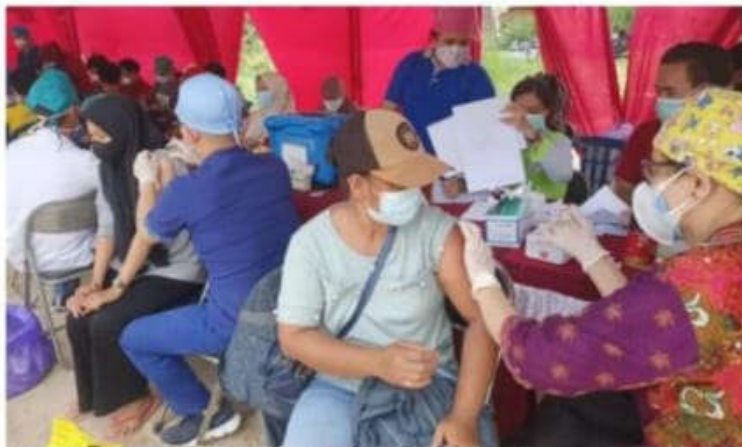
Foto : Sebanyak 1.000 orang warga di wilayah kerja Puskesmas Patas, Kecamatan GBA, Barito kembali menerima vaksinasi Covid-19 tahap pertama dalam giat 'Serbuan Vaksinasi Polda Kalteng' edisi ke-10, Minggu (24/10/2021).

Stevano Petu • 25/10/2021 • Barito Selatan, Terkini • Leave a comment • 1,537 Views