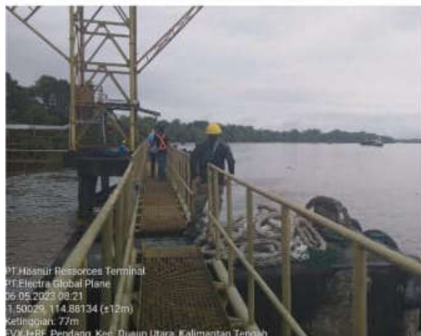
PT. Hasnur Resources Terminal PT. Electra Global Plane 06.05.2023 09:21 1.50029, 114.88134 (±12m) Ketinggian: 77m X:VX+RF, Pendang, Kec. Dusun Utara, Kalimantan Tengah