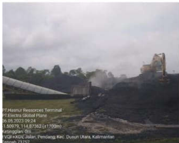
PT. Hasnur Resources Terminal PT. Electra Global Plane 06.05.2023 09:24 1.50979, 114.87362 (±1700m) Ketinggian: 80m X:VQF+XGV, Jalan, Pendang, Kec. Dusun Utara, Kalimantan Tengah 73752